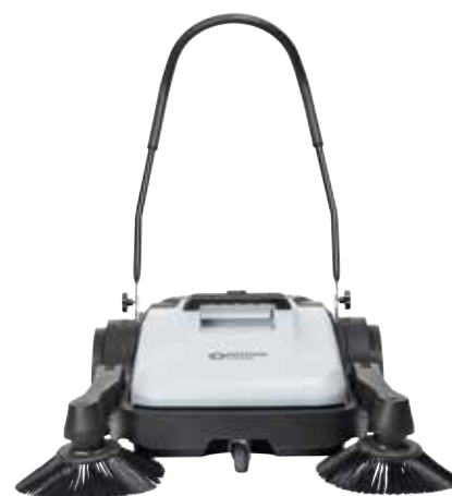
SW200 (1 brosse latérale) – et SW250 (2 brosses latérales) – couvrent des largeurs de nettoyage de 70 cm et 90 cm