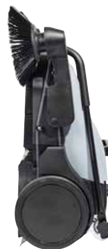
La trémie reste en place même lorsque la balayeuse est stockée en position verticale ou accrochée au mur